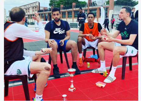
CSP LIMOGES 3x3

Les infrastructures : il s'agit d'un tournoi en extérieur au cœur d'une zone commerciale de l'agglomération berruyère sur la commune de Saint-Doulchard où sera aménagé les terrains officiels de la Fédération pour le 3x3. Des installations exceptionnelles pour la 1ère fois sur ce site à venir découvrir de toute urgence !